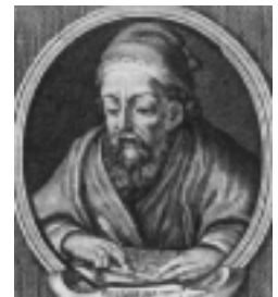
Euklid (330-275 v.Chr.)

Es gibt unendlich viele Primzahlen d.h. es gibt keine größte (letzte) Primzahl.