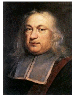
Pierre de Fermat 1601-1665

Nur wenn n selbst eine Zweierpotenz ist, kann z eine Primzahl sein.