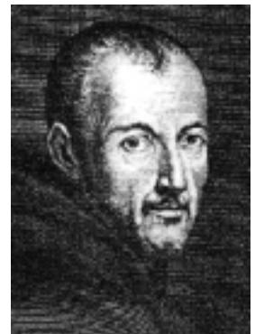
Marin Mersenne (1588-1648)

Ist n eine Primzahl, dann kann z eine Primzahl sein ! (muss aber nicht)